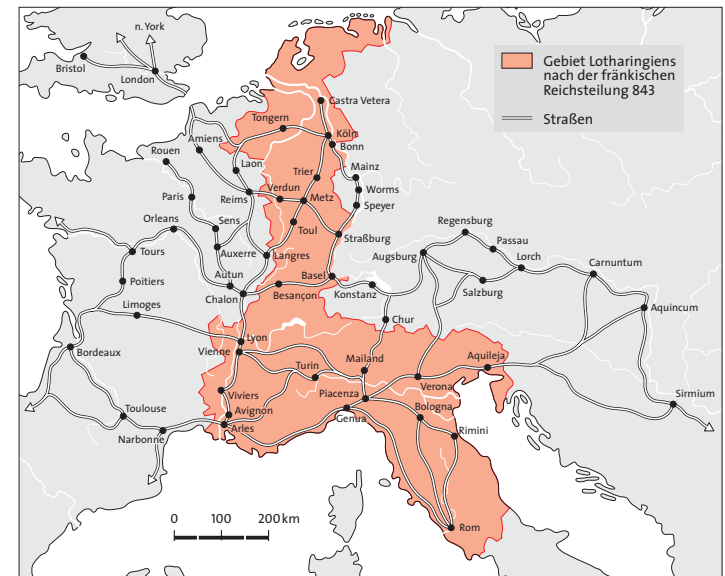
Römische Straßenzüge in der Zeit um 850. Das von den Römern aufgebaute europaweite Straßensystem beförderte in der Zeit nach Karl dem Großen den Waren- und Kulturaustausch.

Die alljährliche Preisverleihung in Aachen zeigt, dass der Karlskult immer noch in Anspruch genommen werden kann. Er schöpft aus reichen historischen Quellen: Christentum und imperiale Tradition, die Berufung auf europäische Kunst und Kultur. Das Christentum