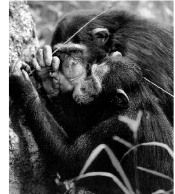
Schimpanse benutzen Werkzeuge, um Termiten zu angeln

Die Unsicherheit in der Beurteilung, ob die Herstellung und Verwendung von Werkzeugen durch Schimpansen bereits Kultur ist oder nicht, beruht zum Teil auf dem Einwand, dass die intelligenten Leistungen, die wir beim Schimpansen beobachten können, nichts weiter als das Resultat individuellen Lernens seien, dass sie durch immer wiederkehrende und gleichartige Erfordernisse des Lebensraumes in Ablauf und Erfolg in engen Grenzen bestimmt werden und nicht auf sozialen Lernprozessen beruhen, die allein Vorausset-