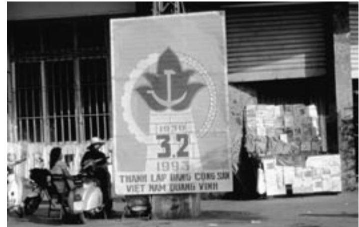
Alle Jahre wieder am 3. Februar in Vietnam (hier 1993): Plakate, die an die Gründung der Kommunistischen Partei am 3. Februar 1930 erinnern. Der Text lautet: »Die Gründung der siegreichen Kommunistischen Partei Vietnams.«

Bei Kriegsbeginn ging er nach Paris, wo er einen neuen Namen annahm: Nguyen Ai Quoc ( Nguyen = Der Patriot). Damals kämpften 100 000 Vietnamesen in der französischen Armee. Ho selbst schrieb ein Theaterstück Der Bambusdrachen , sogar Artikel für die Filmzeitschrift Cinegraph . Er führte eine Art Doppelleben: Als Schriftsteller setzte er sich bei Raymond Poincaré für die Reinheit der französischen Sprache ein; als Revolutionär in Schreiben an US-Präsident Woodrow Wilson für demokratische Freiheiten und Reformen in Vietnam – erwähnte aber noch nicht die Unabhängigkeit. 12 Er selbst traf Wilson nicht, dafür aber wurden Sozialisten wie Léon Blum auf ihn aufmerksam und luden ihn als »Vertreter Indochinas« zu ihrem Kongress in Tours im Dezember 1920 ein. Für Ho war das eine Art Wendepunkt, als er an die Delegierten appellierte: »Im Namen der gesamten Menschheit, im Namen aller Sozialisten, Rechte wie Linke, wir appellieren an Euch, Genossen: Rettet uns!« Ho wechselte dann zu