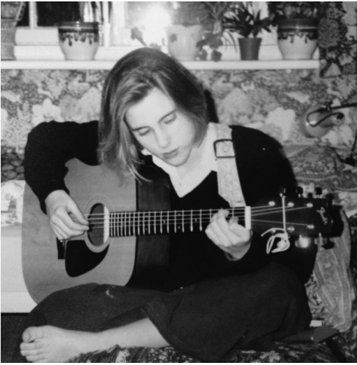
Die Autorin mit 15 Jahren

darüber, wie natürliche Veränderungen der physiologischen Vorgänge in unserem Gehirn sich in den Dingen widerspiegeln, die wir tun, und wie sie darüber bestimmen, zu was für Menschen wir als Erwachsene werden.